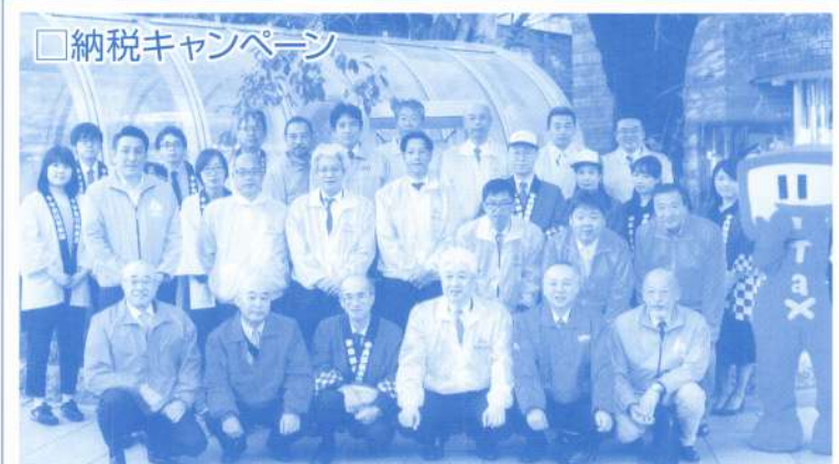
□納税キャンペーン

11月5日(月)に納税啓発塔「銀の門」を中心に納税キャンペーンを実施しました。 11月11日からの「税を考える週間」の周知のため、e-Taxのキャラクター「イータ君」も参加し、税の広報チラシを配りました。