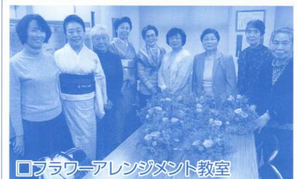
□フラワーアレンジメント教室

10月15日(火)・12月18日(水)に事務局にてアレンジメント教室が開催されました。 年4回、季節の花をふんだんに使って開催していますので興味のある方は是非ご参加ください。